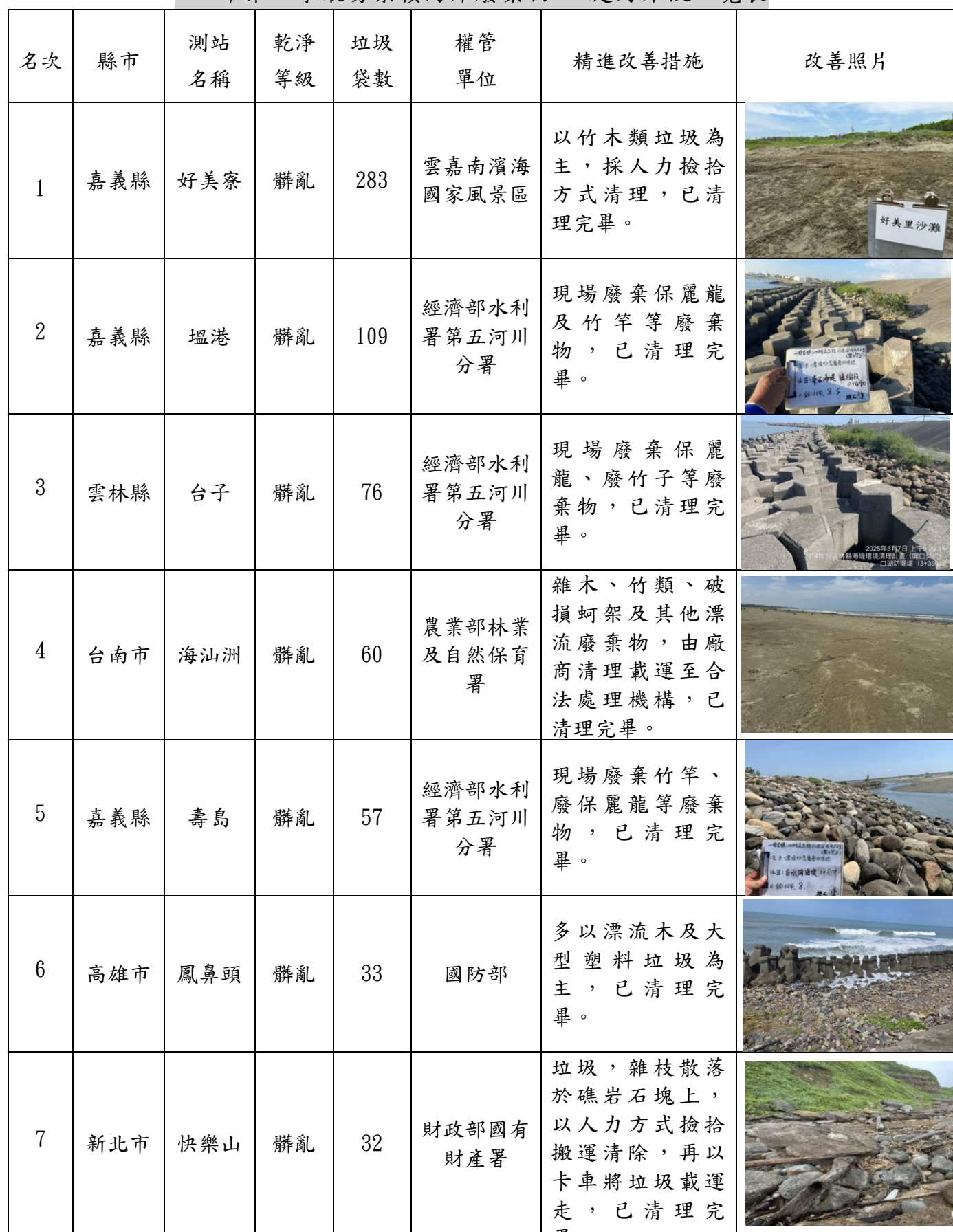
114 年第三季最易累積海岸廢棄物 10 處海岸段一覽表